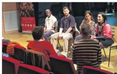
Chaque représentation a été suivie d'un temps d'échange.