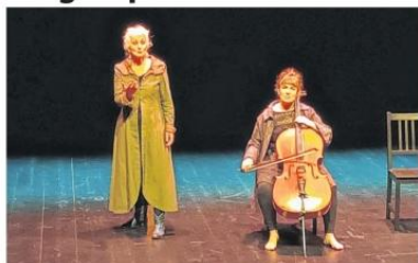
L'envol de la forêt est l'un des spectacles présentés le vendredi 12 avril.